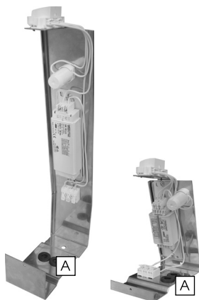
CMD 24, CMD 66, CMD 84