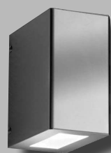
Typ 53 - geschlossen-breit