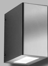
Typ 51- breit-breit