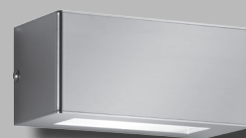
CMD 115 - geschlossen-breit